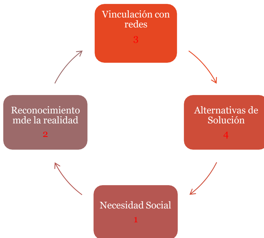
Esquema número 3.

El trabajador Social es el nexo entre todos los participantes; articulándose en la problemática social, generando siempre la capacidad de movilidad y de uso de redes optimizando a la vez cada recurso existente. Al referirse a los participantes no solo se consideran a las familias del programa abriendo Caminos, sino que también a las organizaciones Públicas y privadas, como también al Estado. El rol del Trabajador Social Socioeducativo se podría comprender como conocimiento-acción favoreciendo la integración social para mejorar la calidad de vida de las personas mediante la participación activa. A través de cada sesión que el Trabajador Social realiza en el domicilio de la familia realiza tareas socioeducativas orientadas a resolver la problemática social de habitabilidad, entregando estrategias para que puedan ser aplicadas en el tiempo.